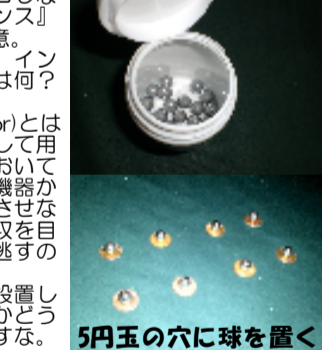
5円玉の穴に球を置く

→はパチンコ玉。最近パチンコしないから、中古台販売屋の『チャンス』さんでGET。それと5円玉を用意。これで何をやるか?インシュレーターにするのよ!それは何?と言う人のために… 『インシュレーター(insulator)とは、何らかの作用の遮断を目的として用いる絶縁材。オーディオ分野においては、アンプやスピーカーなど各機器から生じる振動を、機器間で干渉させないために用いられる。振動の吸収を目的としたもの、振動を速やかに逃すのを目的としたものがある。』とのこと。スピーカーの下に設置して音を変えるんだけど、良い音かどうかは、それぞれの感覚によりますな。