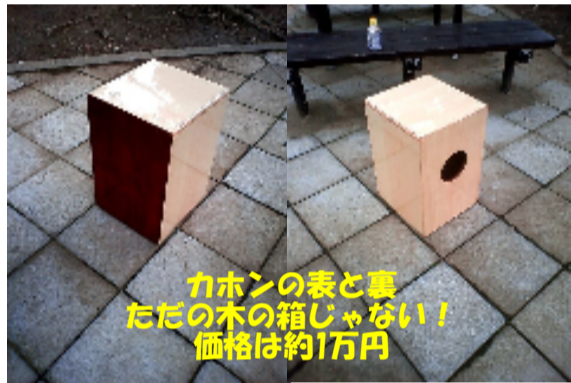
カホンの表と裏 たたきの木の箱じゃない! 価格は約1万円

年度末で3月は2日くらいしか休み無し(泣)よって、新たな探索が出来なかったの、いくらでも出てくる音楽の話題(泣)